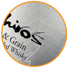
エンボス加工・メタリック紙